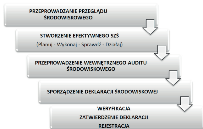
Rysunek 1. Procedura rejestracji w systemie EMAS